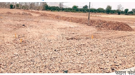
फावट का फल