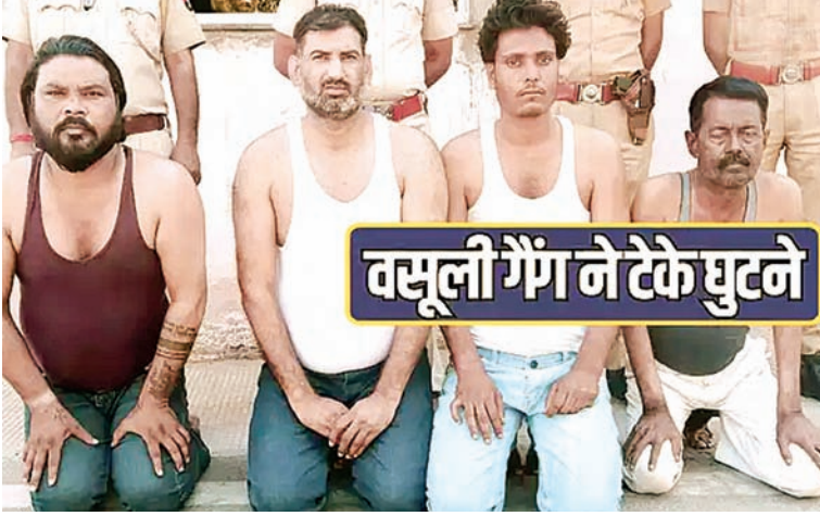
वसूली गैंग ने टैके घुटने

रुपए देने से मना करने पर करवाते थे पत्थरार गैंग के 4 सदस्य गिरफ्तार; वसूली की रकम भी बरामद पुलिस ने 45360 रुपए जब्त किए