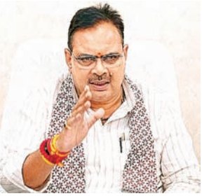
में 2 प्रतिशत की वृद्धि के एक सप्ताह बाद उठाया गया है। इस फैसले से राज्य के करीब 8 लाख कर्मचारियों

जयपुर। राजस्थान के सरकारी कर्मचारियों और पेंशनर्स के लिए राज्य सरकार की ओर से एक खुशखबरी है। राजस्थान के मुख्यमंत्री भजनलाल शर्मा ने कर्मचारियों के महंगाई भत्ते में 2 प्रतिशत की वृद्धि को मंजूरी दे दी। अब राज्य के कर्मचारियों और पेंशनर्स को 55 प्रतिशत महंगाई भत्ता मिलेगा, जो एक जनवरी 2025 से लागू होगा। यह कदम केंद्र सरकार द्वारा अपने कर्मचारियों और पेंशनभोगियों के डीए और महंगाई राहत