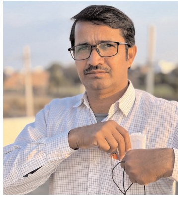
रामनगर जाट वरिष्ठ पत्रकार

कमिश्नखोरी, रिश्वत और भ्रष्टाचार आज किसी एक विभाग, एक सरकार या एक पार्टी की समस्या नहीं रह गए हैं, बल्कि यह पूरे सरकारी सिस्टम की नसों में दौड़ता हुआ जहर बन चुका है। ऐसा जहर, जो रक्त का स्थान ले चुका है, यानी सरकारी सिस्टम वाले इसके बिना जी भी नहीं सकते। यह जहर इतना गहरा उतर चुका है कि अब घोटाले अपवाद नहीं, बल्कि व्यवस्था का स्थायी चरित्र बनते जा रहे हैं। जिस सरकारी सिस्टम का उद्देश्य आम आदमी को राहत देना, सार्वजनिक धन का ईमानदार उपयोग करना और विकास को जमीन तक पहुंचाना था, वही सिस्टम आज लूट, मुनाफाखोरी और संगठित भ्रष्टाचार का सबसे बड़ा अड्डा बन गया है। बाजार में 400-500 रुपये में आसानी से मिलने वाली छात्रों के लिए खरीदी जाने वाली एक साधारण दरी सरकार 15,000 रुपये में क्रय करती है और फिर भी कोई सवाल नहीं उठता, कोई ज़िम्मेदारी तय नहीं