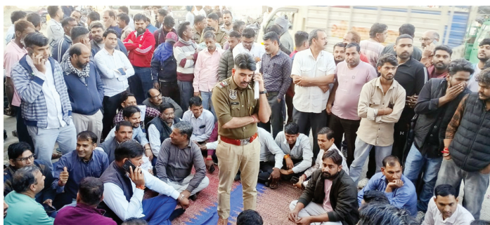
होकर भारी वाहनों का गुजरना कभी भी बड़े हादसे का कारण बन सकता है। इसको लेकर ग्रामवासियों द्वारा प्रशासन से मांग की गई है कि ग्राम पंचायत

खोराबिसल (जालसू) । ग्राम पंचायत खोराबिसल, पंचायत समिति जालसू, जिला जयपुर की मुख्य आबादी क्षेत्र से प्रतिदिन भारी वाहनों एवं ट्रकों का आवागमन लगातार बढ़ता जा रहा है। भारी वाहनों की आवाजाही से आमजन को भारी परेशानियों का सामना करना पड़ रहा है तथा दुर्घटनाओं की आशंका बनी रहती है, विशेषकर बच्चों, बुजुर्गों एवं महिलाओं की सुरक्षा को लेकर ग्रामवासियों में चिंता व्याप्त है। ग्रामीणों ने बताया कि संकरी सड़कों से